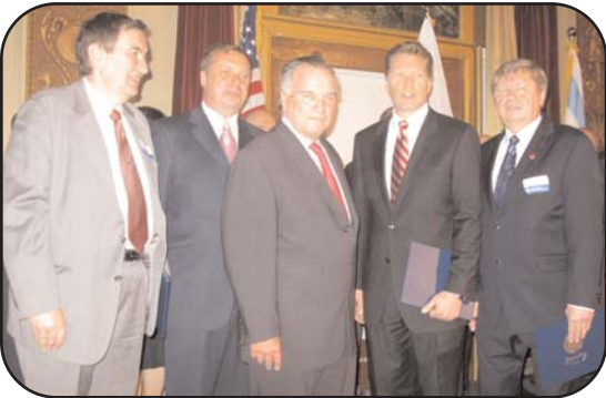
Akademia z okazji obchodów Dnia Konstytucji 3 Maja zorganizowana przez biuro burmistrza.

Drodzy Czytelnicy, czekam na uwagi, komentarze i na Wasze listy. Piszcie na adres: 984 N. Milwaukee Ave, Chicago, IL. 60642 telefonicznie 1-800-772-8632 wew. 2643, lub przez e-mail: fraternal.department@prcu.org . Do następnego spotkania na łamach tej gazetki.