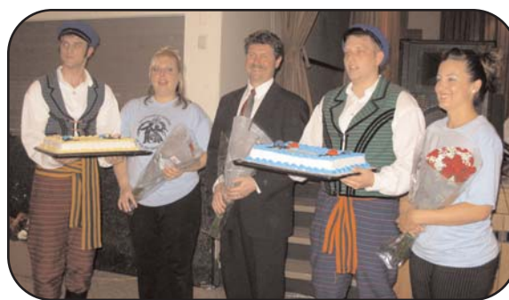
Podziękowanie dla choreografów i instruktorów.