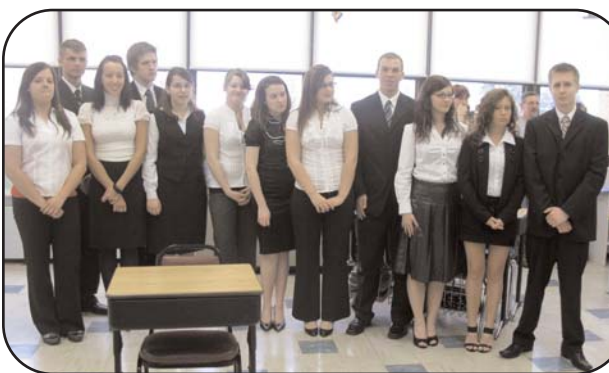
Komisja egzaminacyjna i maturzyści w czasie matur w Polskiej Szkole im. Jana Pawła II.